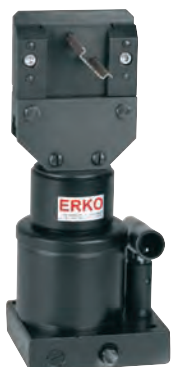
GLS 1 typ 1 profil