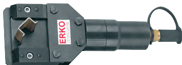
GLP 2 typ 2 profily